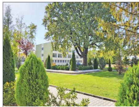
Обновените паркови пространства

тизация и роботизация на производствените процеси. Изградени са редица важни обекти на територията на дружеството. Правим пълно обновление на парковете в дружеството.