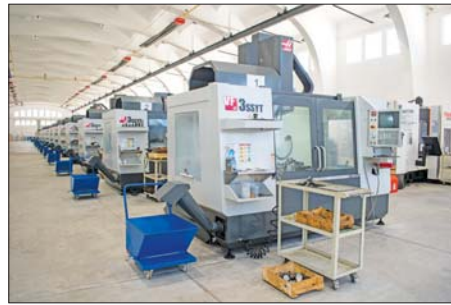
Част от цеховете с ново, модерно оборудване

с контрола в специалните производства. Кунихме нов завод в Стара Загора, където се въвеждат автома-