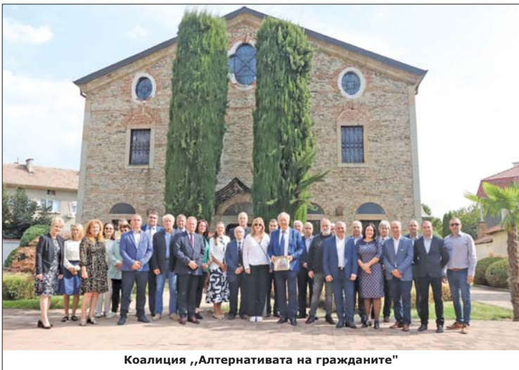
Коалиция „Алтернативата на гражданите“