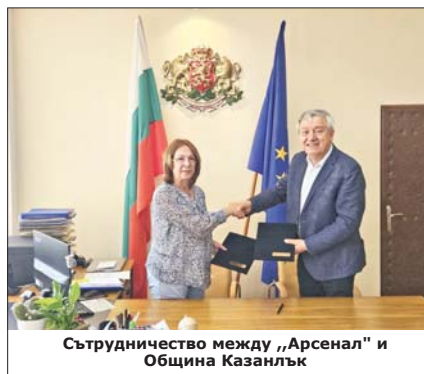
Сътрудничество между „Арсенал“ и Община Казанлък

гостите на града бе големият празничен концерт на Фолклорен ансамбъл „Арсе-