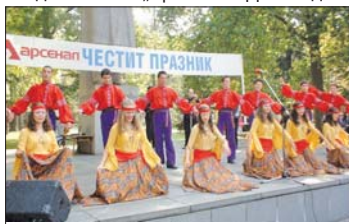
Фолклорен ансамбъл „Арсенал“, 2005 г.

След 1989 г. в „Арсенал“ АД този ден се отбелязва като фирмен празник. Организираща се най-често пред паметника на Фридрих Енгелс. Провежда се и на фирмения стадион, в парка пред музея или в Дома на културата в центъра на града и Спортна зала „Арсенал“.