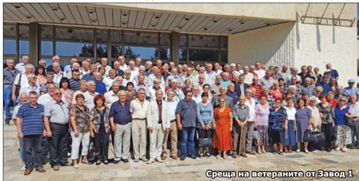
Среща на ветераните от Завод 1

През 2012 г. Завод 5 поставя началото на още една традиция – ежегодни срещи на ветераните оръжейници, продължена от Завод 1 и други поделения на