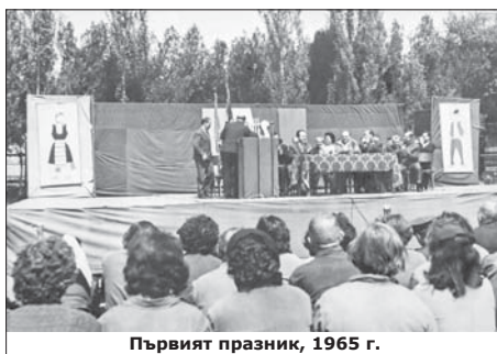
Първият празник, 1965 г.

На казанлъшка земя, в ОПП „Фридрих Енгелс“, празникът за пръв път е организиран през 1965 г. като Ден на машиностроителя – знак, че машиностроенето е в основата на българската промишленост. С