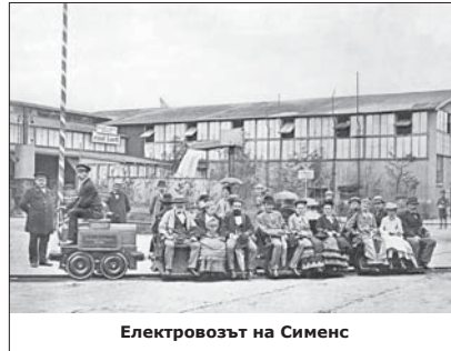
Електровозът на Сименс

пуснат през 1882 г. на 500-метрова листа, движел се с 12 км/час, возел по 4-5 души. Два електрически мотора с мощност 3 к.с. задвиждали задните колела. Гъвкав кабел го свързвал с електрическата мрежа чрез контактно колело, наречено от Сименс Kontaktwagen, дума, преведена по-късно на английски като trolley.