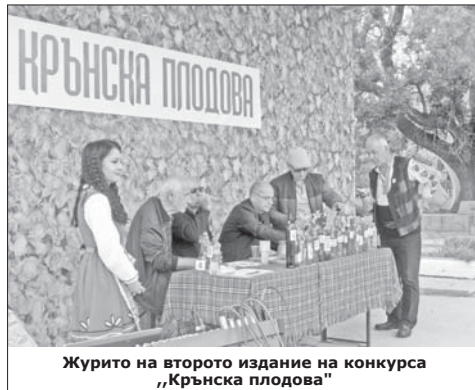
Журито на второто издание на конкурса „Крънска плодова“

две нови улици са изцяло ремонтирани, още две са изпълнени в рамките на Инвестиционната програма в Бюджет 2024 на Община Казанлък. В Крън се очакват още 800 хил. лв., предвидени за пет други улици в рамките на програмата за ремонти, финансирана с общински кредит от общо 5 млн. лв., обяснява кметът. Ако всичко върви по план, за две години управление на Малаков Крън ще има 12 обновени улици. Основно сега се асфалтира в източната част на населеното място, където вече има нова канализация. Там е и голяма част от движението към предприятията – Заводът за пружини и „Суперабразив“, до които достъпът ще се облекчи. „Работническа“ и „Ив. Димитров“ ще имат нов асфалт, на „Орешака“ ще се правят и