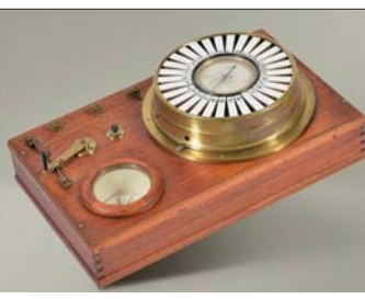
Стрелочният телеграф на Сименс

който участвал негов приятел. В затора разработил техника за галаванопластика – за нанасяне на златни и сребърни покрития върху метални предмети. Патентовал метода си и го продал за 1500 фунта. Открил за себе си блестяща перспектива, но ранната смърт на родителите му го принудила да поеме грижите за братята и сестрите си. Бил на 24 години.