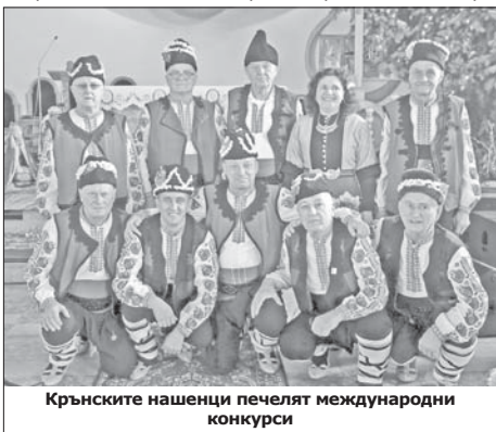
Крънските нашенци печелят международни конкурси

ца, Радиево и в други села и градове. Традиционно участваме в програмата на всеки празник в Крън, разбира се, и в Празника на града ни, който