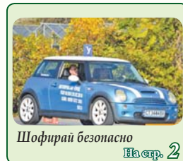
Шофирай безопасно № стр. 2