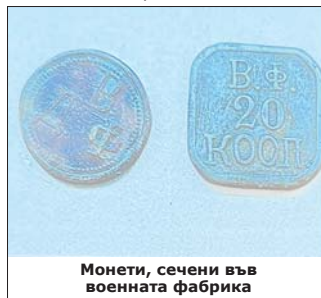
Монети, сечени във военната фабрика

Регионален академичен център – Казанлък. Уникален резултат от работата е съставеният нов и първи по рода си тук Библиотечен указател със справочна информация по всички публикации с арсеналска тема. Всеки читател и изследовател в бъдеще ще може да ползва този указател, който е съставен по азбучен ред. Огромният труд на библиотекарите, продължил над половин година, към момента е