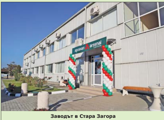
Заводът в Стара Загора

жение, състояние на сградите, транспортната свързаност удовлетворяват изискванията на „Арсенал“ за развитие