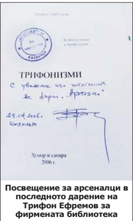
Посвещение за арсеналци в последното дарение на Трифон Ефремов за фирмената библиотека

периода от местната преса, през „Смях“, „Ретро“, „Минаха години“ и „Втора младост“ до култовия „Сършел“, Трифон се помни като един по-скоро затворен в себе си човек, под късата периферия на чиято шапка на скромен интелегент от 1980-те надзърта леко сърдит, овладяно ироничен поглед.