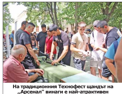
На традиционния Технофест щандът на „Арсенал“ винаги е най-атрактивен

бъде третото му издание, в което участват възпитаници на гимназията от специалностите „Мехатроника“ и „Машини и системи с ЦПУ“. На 14 април в зала „Иван Милев“ в Казанлък ще бъде открита юбилейната изложба „100 години история“. На 25 април тържествата ще започнат в 11.30 часа с инициативата „На кафе със спомени“. Денят на отворените врати, наречен професиографска обиколка „Иван Хаджиенов – непознатият познат“, започва в 12.30. При обиколката бивши и настоящи възпитаници, преподаватели, партньори и приятели на Механото, едно от най-старите технически училища в България, ще могат да видят предварително обособени зони – работилниците, учебните кабинети, музея и др. В 14.30 часа ще бъдат поднесени цветя и венци пред паметника на патрона в училищния двор, след което започва традиционното шествие на хаджиеновци по улиците на града. От 16.30 часа е тържественният концерт в Дома на културата „Арсенал“. Програмата за юбилея ще бъде допълнена с още мероприятия през цялата година. Ди-