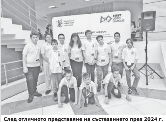
След отличното представяне на състезанието през 2024 г. ране и роботика (ДАПР) на „ИКТ Център“ за неговото участие в Световното състезание First Lego тичен пакет FLL CHALLENGE, състезателен Lego Spike комплект, такса за участие

От 2023 г. България се включва във FLL, а през 2024 г. се проведе фестивал в Пловдив, на който бяха поканени само класираните 24 отбора от „Роботика за България“. В това число бяха и представителите на Казанлък, който е един от 13-те града с отбори на първия фестивал. През 2024 г. се състоя първото национално състезание за България в Бургас. Допуснати бяха за участие само организациите и училищата, класирани предишната година. ДАПР „ИКТ Център“ се включи с максимален брой отбори – два. CyberRobo с ученици на възраст 11-12 години се представи много добре с 5-о място в категорията „Робоигра, управление на роботите“ и 8-ми в крайното класиране. Това е постижение при 26 най-добри отбора, повечето с участници от професионални гимназии! Тази година децата отново ще премерят сили в сезон '2025 и ще го направят благодарение на подкрепата на „Алтернативата на гражданите“ – Казанлък.