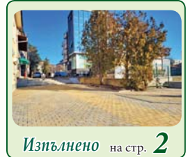
Изгледено на стр. 2