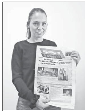
С броя на в. „Трибуна Арсенал“ за фамилията от 2016-а