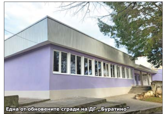
Една от обновените сгради на ДГ „Буратино“

Обновяването започна още през есента на 2024-та с основен ремонт на бившия Музикален салон. Арсеналските строители от Строително-ремонтния цех на дружеството с ръководител Татяна Ирязова направиха покривната конструкция, а после в реконструкцията се включиха и други фирми. Всяка от строителните дейности е планирана от ръководството на „Арсенал“ и финансирана от фирмата. Извършено е външно саниране на сградата, последвано от пълното обновяване на помещението, включващо боядисване, изграждане на нови ел.- и ВИК-инстала-