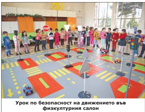
Урок по безопасност на движението във физкултурния салон