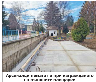
Арсеналци помагат и при изграждането на външните площадки